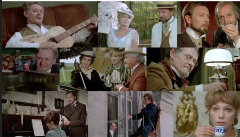
"Lalka", kiedy mama wchodzi do pokoju: